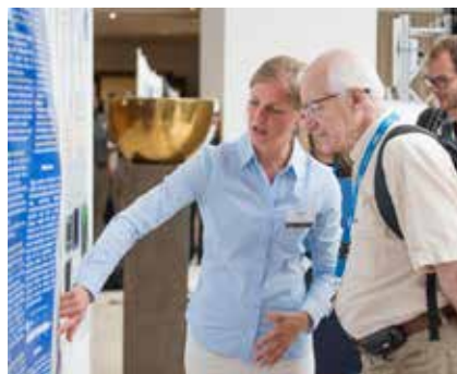
Posterpräsentation auf der Future Circular Collider (FCC) Konferenz in Berlin