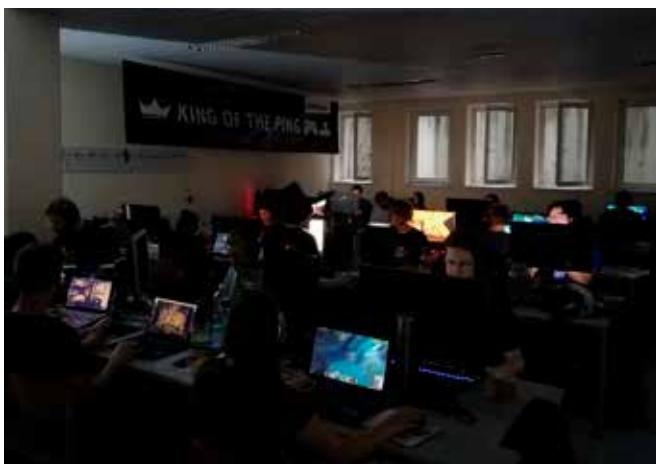
Die Lanparty ist in vollem Gange

und die Unterstützung durch die Liwest Kabelmedien GmbH. Mit dieser Kooperation steht einer Fortsetzung der JKU LAN auch im Herbst 2018 nichts im Wege!