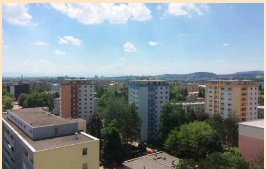
Ausblick vom WIST-Heim über den Stadtteil