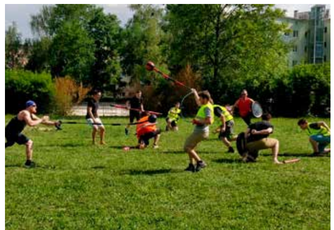
Jugger Probetraining auf der Uniwiese