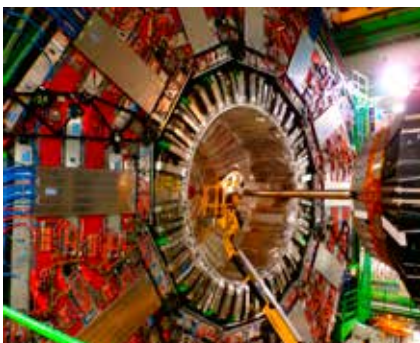
CMS Detektor am CERN in Genf

Zum Schluss möchte ich euch noch einen Tipp geben: Es ist zwar mühsam, sich immer wieder neu einzuarbeiten, aber während des Studiums bietet sich die perfekte Gelegenheit verschiedenste Praktika zu besuchen, neue Anwendungsmethoden kennen zu lernen und so seine eigenen Stärken und Interessen zu finden. Ich wünsch' euch viel Glück und Erfolg für die kommenden Prüfungen und für euren zukünftigen Berufsweg.