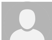
§ du? Melde dich bei uns!